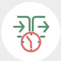
Historie aller An- und Abmeldungen