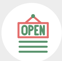
Historie aller Öffnungen