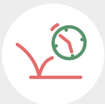
Historie aller Bounces