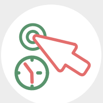
Historie aller Klicks