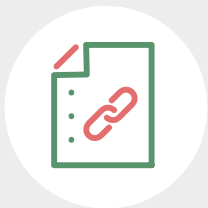
Liste aller versandten Links